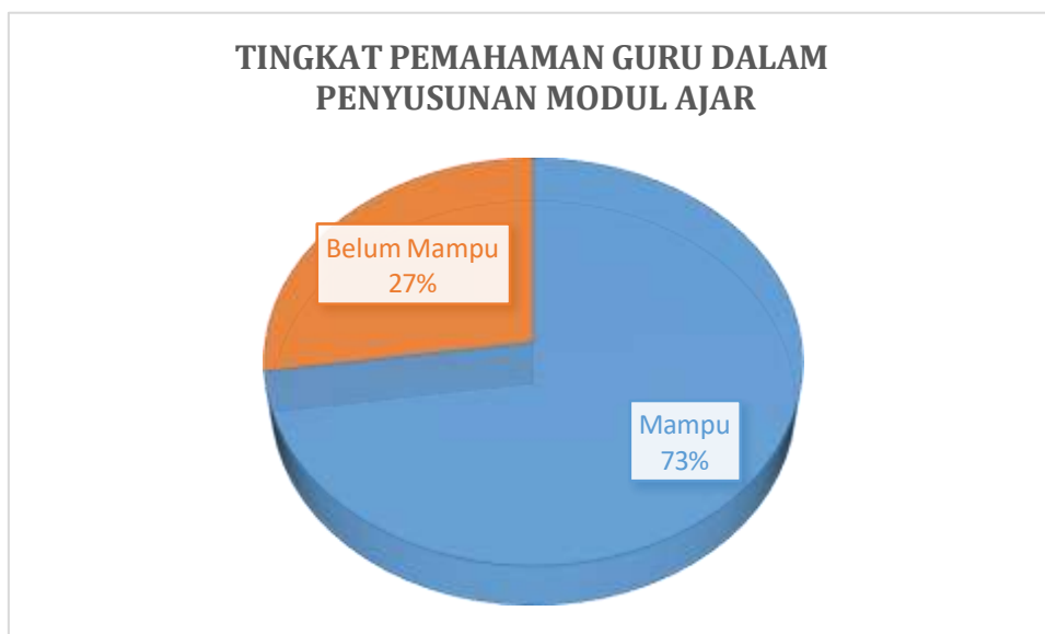
Diagram 2. Pemahaman Peserta dalam Penyusunan Rencana Pelaksanaan Pembelajaran

Berdasarkan diagram di atas, dapat dijelaskan bahwa motivasi ustadz dan ustadzah mengikuti kegiatan ini sangat baik. Dari 35 ustadz dan ustadzah , semuanya mempunyai motivasi yang tinggi dalam mengikuti kegiatan pelatihan dan pendampingan penyusunan Modul Ajar.