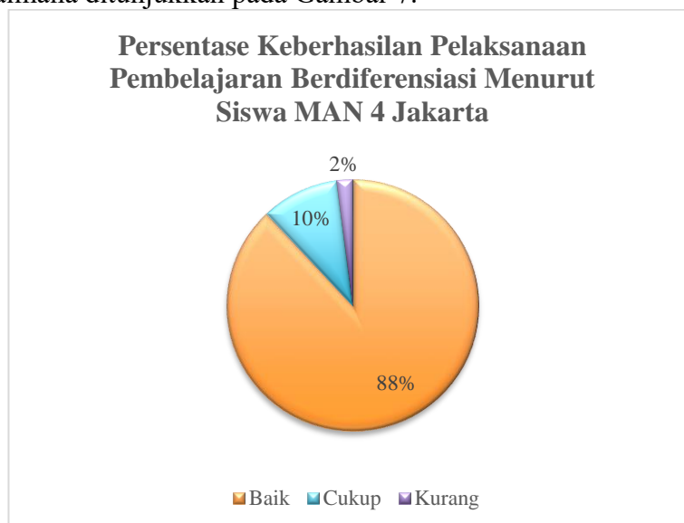
Gambar 7. Hasil Angket Siswa

Selain dari sisi guru, evaluasi juga dilakukan kepada siswa. Evaluasi kepada siswa hanya didasarkan pada proses pelaksanaan pembelajaran berdiferensiasi yang telah dilakukan oleh guru-guru di kelasnya. Secara umum, siswa-siswa dari kelas X, XI, dan XII seluruhnya menyatakan bahwa guru telah berhasil mengimplementasikan pembelajaran berdiferensiasi dengan baik. Hal tersebut ditunjukkan dengan sebagian besar siswa menyatakan bahwa keberhasilan pembelajarannya berada dalam kategori “Baik” sebagaimana ditunjukkan pada Gambar 7.