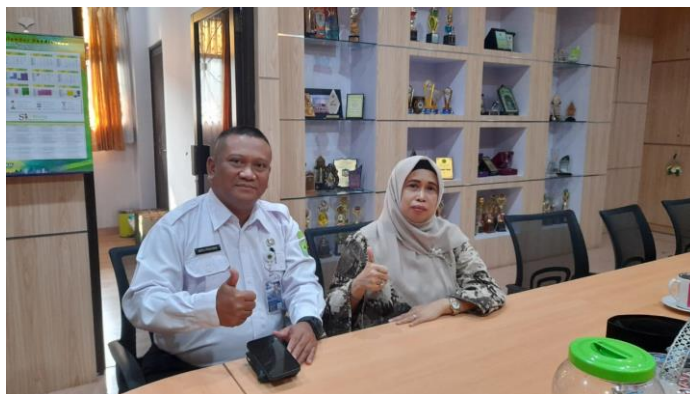
Gambar 1. Wawancara dengan Kepala Sekolah

Kedua , Perencanaan solusi. Mengingat pentingnya informasi tentang pembelajaran berdiferensiasi untuk diterima guru, maka selanjutnya dilakukan Focus Group Discussion (FGD) antar tim pengabdian untuk merumuskan solusi yang tepat. FGD tersebut memutuskan untuk melakukan Workshop kepada guru-guru MAN 4 Jakarta. Selanjutnya, juga dirumuskan berbagai kebutuhan yang diperlukan selama kegiatan pengabdian berlangsung seperti peralatan yang digunakan ( sound system , LCD proyektor, dan sebagainya) dan bahan habis pakai seperti konsumsi untuk peserta, background , dan kenang-kenangan untuk sekolah. Selain itu, juga perencanaan kegiatan, mulai dari ruangan yang akan digunakan, waktu pelaksanaan kegiatan, jumlah guru yang akan menjadi peserta, narasumber yang akan mengisi kegiatan, dan sebagainya.