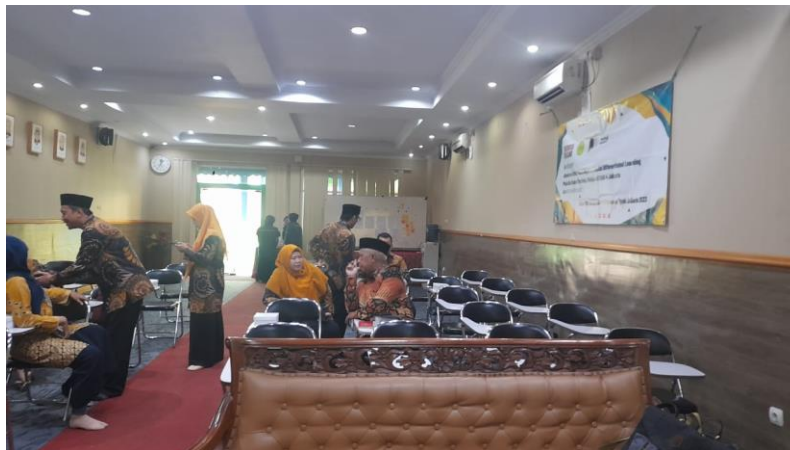
Gambar 3. Persiapan Sebelum Acara Dimulai

Kegiatan pengabdian dilakukan hingga pukul 12.00 WIB dengan narasumber utama adalah Dr. Rabiatul Adawiyah, M.Pd. yang merupakan ketua Pengabdian kepada Masyarakat. Peserta yang menerima workshop ini adalah perwakilan guru-guru dari setiap mata pelajaran di MAN 4 Jakarta. Setiap mata pelajaran, diwakilkan oleh satu orang guru dengan harapan nantinya akan dilakukan mentoring secara peer-teaching antara guru yang mengikuti workshop dengan guru yang tidak mengikutinya. Proses pelaksanaan workshop yang dilakukan dengan sistem perwakilan ini juga dikarenakan adanya keterbatasan tenaga guru. Kegiatan pengabdian dilakukan bersamaan dengan pembelajaran di sekolah sehingga tidak memungkinkan semua guru untuk mengikuti kegiatan ini mengingat guru harus mengajar siswa di kelas. Beberapa perwakilan guru yang mengikuti workshop ditunjukkan oleh Gambar 4.