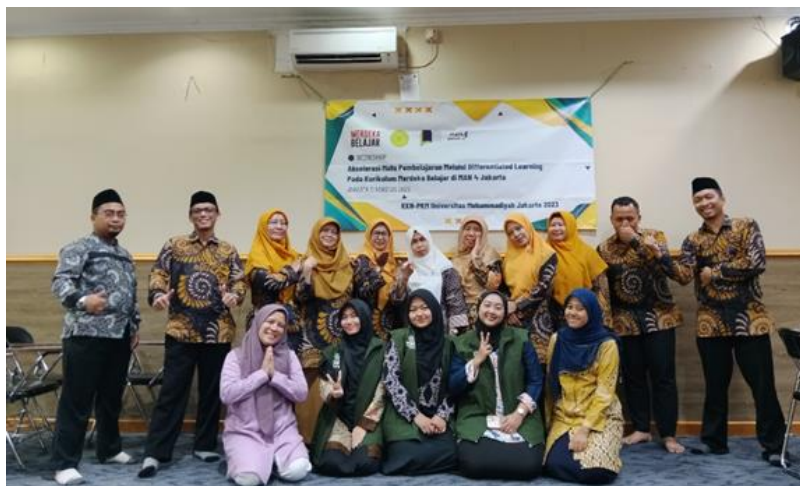
Gambar 4. Perwakilan Guru Berfoto Bersama Tim Pengabdian

Setelah disampaikan materi secara menyeluruh, selanjutnya masing-masing guru mencoba untuk mengembangkan pembelajaran berdiferensiasi sebagaimana yang telah diajarkan. Salah satu guru selanjutnya menjelaskan dan mempraktikkan ke depan tentang rencana pelaksanaan pembelajaran berdiferensiasi yang akan diterapkan pada mata pelajarannya di kelas. Gambar 5 menunjukkan bahwa pemateri telah selesai menyampaikan materinya dan salah satu guru sedang mempresentasikan tentang rencana pembelajaran berdiferensiasi yang akan dilaksanakan pada pembelajarannya. Disela-sela pelaksanaan pemberian materi maupun pengerjaan tugas workshop, guru dapat bertanya kepada pemateri tentang hal-hal yang belum dipahami. Guru-guru juga antusias untuk bertanya, yaitu setidaknya tiga guru bertanya setelah penyampaian materi dan sepuluh guru bertanya tentang tugas workshopnya.