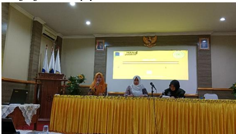
Gambar 5. Penyampaian oleh Pemateri (tengah) dan Praktik oleh Perwakilan Peserta (kiri)

Setelah disampaikan materi secara menyeluruh, selanjutnya masing-masing guru mencoba untuk mengembangkan pembelajaran berdiferensiasi sebagaimana yang telah diajarkan. Salah satu guru selanjutnya menjelaskan dan mempraktikkan ke depan tentang rencana pelaksanaan pembelajaran berdiferensiasi yang akan diterapkan pada mata pelajarannya di kelas. Gambar 5 menunjukkan bahwa pemateri telah selesai menyampaikan materinya dan salah satu guru sedang mempresentasikan tentang rencana pembelajaran berdiferensiasi yang akan dilaksanakan pada pembelajarannya. Disela-sela pelaksanaan pemberian materi maupun pengerjaan tugas workshop, guru dapat bertanya kepada pemateri tentang hal-hal yang belum dipahami. Guru-guru juga antusias untuk bertanya, yaitu setidaknya tiga guru bertanya setelah penyampaian materi dan sepuluh guru bertanya tentang tugas workshopnya.