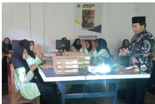
Gambar 2. Ice Breaking

Praktik latihan mengetik tulisan Arab ini dibagi ke dalam dua sesi, yakni praktik latihan mengetik menggunakan on-screen keyboard dan menggunakan keyboard laptop. Pada sesi praktik latihan pertama, yakni sesi praktik latihan mengetik menggunakan on-screen keyboard, pelatih membimbing peserta pelatihan untuk memunculkan on-screen keyboard serta mengganti bahasa input terlebih dahulu kemudian baru mulai berlatih mengetik sesuai dengan kata serta kalimat yang ditampilkan di layar. Karena jumlah laptop yang tersedia hanya 15 unit, maka sesi praktik latihan mengetik ini dibagi menjadi dua kloter di mana setiap kloter diisi oleh 13 peserta pelatihan dengan durasi waktu kurang lebih 40 menit setiap kloternya. Setelah kloter pertama selesai, tim pelatih mengoreksi hasil ketikan peserta pelatihan dan membenarkan disertai dengan penjelasan apabila menemukan ada ketikan mereka yang salah. Setelah semua hasil latihan selesai dikoreksi, maka kegiatan praktik latihan dilanjutkan kloter kedua dengan materi pengetikan yang berbeda dengan kloter sebelumnya. Kegiatan praktik pada kloter dua ini sebagaimana kloter pertama.