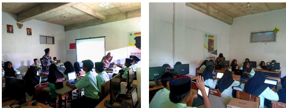
Gambar 5. Evaluasi Terhadap Hasil Pelatihan Keterampilan Mengetik