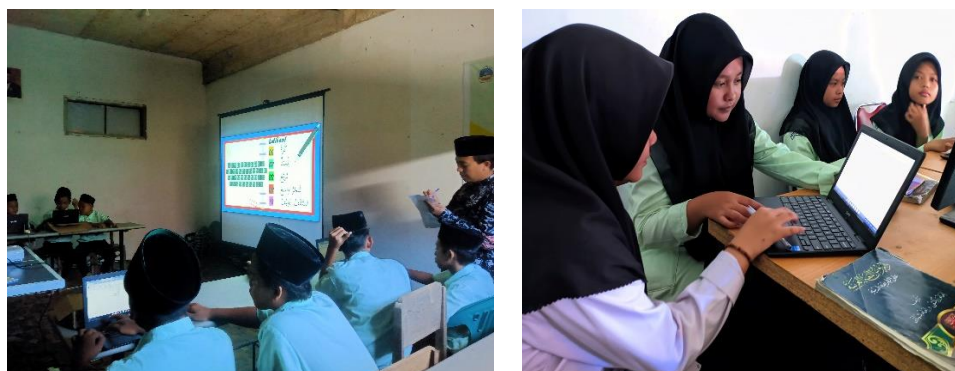
Gambar 4. Praktik Latihan Mengetik Menggunakan Keyboard Laptop

Arab terlebih dulu, kemudian baru melaksanakan rangkaian kegiatan sebagaimana praktik latihan menulis pada hari sebelumnya. Adapun durasi waktu yang diberikan pada setiap kloter kurang lebih 30 menit dengan materi tulisan pada setiap kloter berbeda dengan hari sebelumnya.