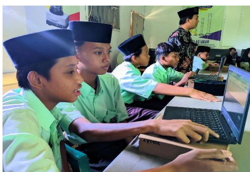
Gambar 3. Praktik Latihan Mengetik Menggunakan On-Screen Keyboard

Praktik latihan mengetik tulisan Arab ini dibagi ke dalam dua sesi, yakni praktik latihan mengetik menggunakan on-screen keyboard dan menggunakan keyboard laptop. Pada sesi praktik latihan pertama, yakni sesi praktik latihan mengetik menggunakan on-screen keyboard, pelatih membimbing peserta pelatihan untuk memunculkan on-screen keyboard serta mengganti bahasa input terlebih dahulu kemudian baru mulai berlatih mengetik sesuai dengan kata serta kalimat yang ditampilkan di layar. Karena jumlah laptop yang tersedia hanya 15 unit, maka sesi praktik latihan mengetik ini dibagi menjadi dua kloter di mana setiap kloter diisi oleh 13 peserta pelatihan dengan durasi waktu kurang lebih 40 menit setiap kloternya. Setelah kloter pertama selesai, tim pelatih mengoreksi hasil ketikan peserta pelatihan dan membenarkan disertai dengan penjelasan apabila menemukan ada ketikan mereka yang salah. Setelah semua hasil latihan selesai dikoreksi, maka kegiatan praktik latihan dilanjutkan kloter kedua dengan materi pengetikan yang berbeda dengan kloter sebelumnya. Kegiatan praktik pada kloter dua ini sebagaimana kloter pertama.