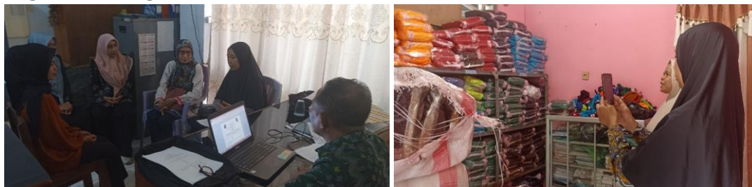
Gambar 1. Kegiatan FGD bersama (Tim Pelaksana, Mitra Wilayah, dan Mitra Sasaran), Serta Observasi Ketersediaan Bahan Baku Benang Tenun

Pemetaan ini memberikan gambaran yang jelas tentang kekuatan dan tantangan yang dihadapi masyarakat. Hasil ini menunjukkan bahwa masyarakat memiliki pemahaman yang baik mengenai potensi lokal mereka, tetapi membutuhkan dukungan lebih lanjut dalam hal pengembangan kapasitas untuk mengatasi berbagai hambatan.