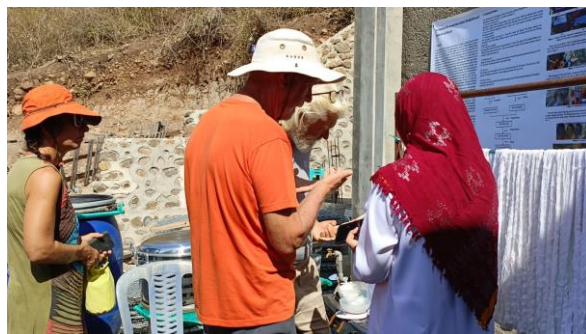
Gambar 5. Pelaksana memberikan penjelasan proses pewarnaan alam pada wisatawan yang berkunjung

Upaya masyarakat Ntobo dalam mengembangkan produk wisata berkelanjutan telah memberikan dampak positif yang signifikan. Produk tenun yang ramah lingkungan tidak hanya menarik minat wisatawan, tetapi juga meningkatkan nilai tambah produk lokal. Selain itu, kegiatan ini juga berkontribusi pada pelestarian budaya dan lingkungan di Ntobo.