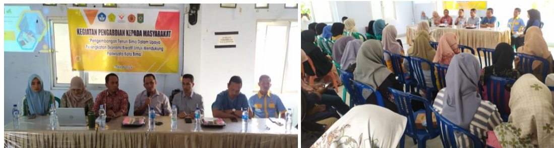
Gambar 2. Pelaksanaan Seminar Penggalan Potensi Wisata

terlibat aktif dalam mengidentifikasi dan memetakan potensi wisata berbasis tenun Bima (Andajani, E., dkk, 2017).