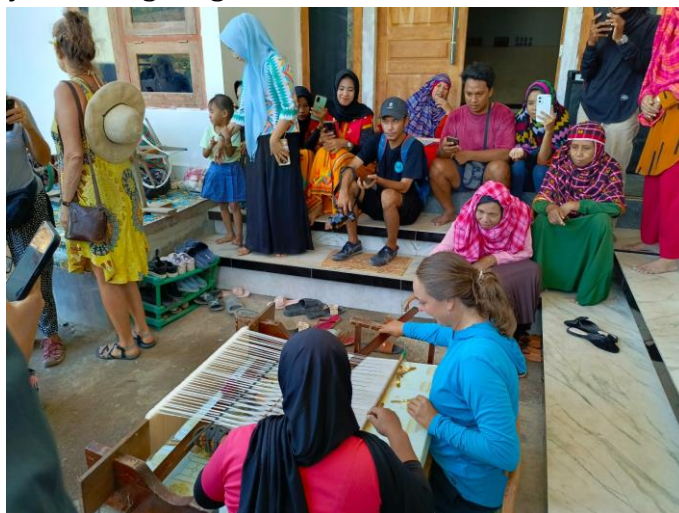
Gambar 6. Wisatawan mancanegara mencoba langsung menenun dengan pendampingan pengrajin tenun UKM Dina

Upaya masyarakat Ntobo dalam mengembangkan produk wisata berkelanjutan telah memberikan dampak positif yang signifikan. Produk tenun yang ramah lingkungan tidak hanya menarik minat wisatawan, tetapi juga meningkatkan nilai tambah produk lokal. Selain itu, kegiatan ini juga berkontribusi pada pelestarian budaya dan lingkungan di Ntobo.