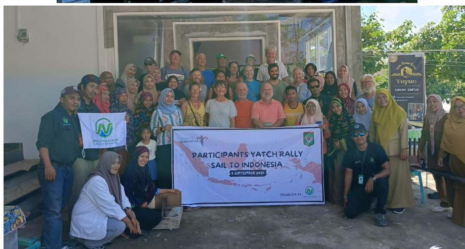
Gambar 7. Kunjungan Wisatawan mancanegara serta partisipasi aktif masyarakat Kelurahan Ntobo