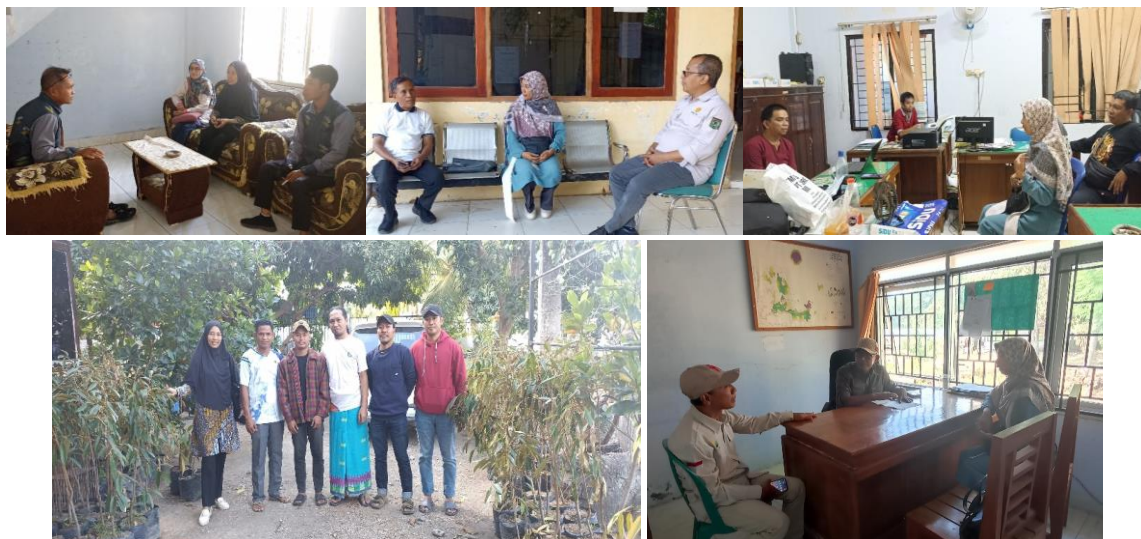
Gambar 4. Kerjasama serta kolaborasi dengan pihak-pihak terkait: Kelurahan Ntobo, Dinas Pertanian, Dinas Pariwisata, DLH, Balai KPH, dan Tokoh Peduli Lingkungan

sebagai pewarna alam, promosi dan pemasaran produk tenun, dan akses ke pelatihan serta sumber daya yang lebih luas. Kolaborasi ini memungkinkan masyarakat untuk mendapatkan pendampingan secara langsung dalam mengembangkan produk tenun berbasis wisata yang lebih profesional (Kurniawan, F., 2013).