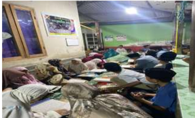
Gambar 2. Pemberian materi tentang makharijul huruf.

menggunakan buku iqro' untuk lebih memudahkan anak-anak dalam memahami bagaimana cara pelafalan makharijul huruf yang baik dan benar. Agar proses pembelajaran berjalan dengan lancar, pemberian materi makharijul huruf diberikan secara bertahap.