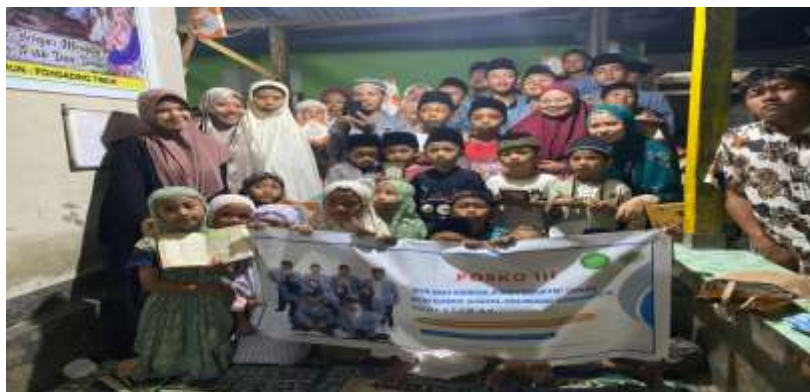
Gambar 4. Foto bersama di TPQ Sunanul Huda

Bimbingan makharijul huruf ini berjalan dengan lancar karena bantuan dari tenaga pendidik setempat serta semangat yang luar biasa dari anak-anak TPQ Sunanul Huda yang selalu sabar dan tetap istiqomah mengikuti bimbingan ini sampai selesai. Namun dalam prosesnya, tentu saja bimbingan dasar makharijul huruf ini juga terdapat beberapa kendala, misalnya beberapa anak masih bingung dalam membedakan makhraj dari huruf-huruf hijaiyah, bunyi dan gerak-gerik mulut dalam pelafalannya. Disisi lain, dengan diadakannya bimbingan dasar makharijul huruf ini membawa banyak perubahan seperti meningkatkan kemampuan membaca Al-Qur'an anak-anak di TPQ Sunanul Huda, dalam hal ini pemahaman anak-anak tentang makharijul huruf meningkat.