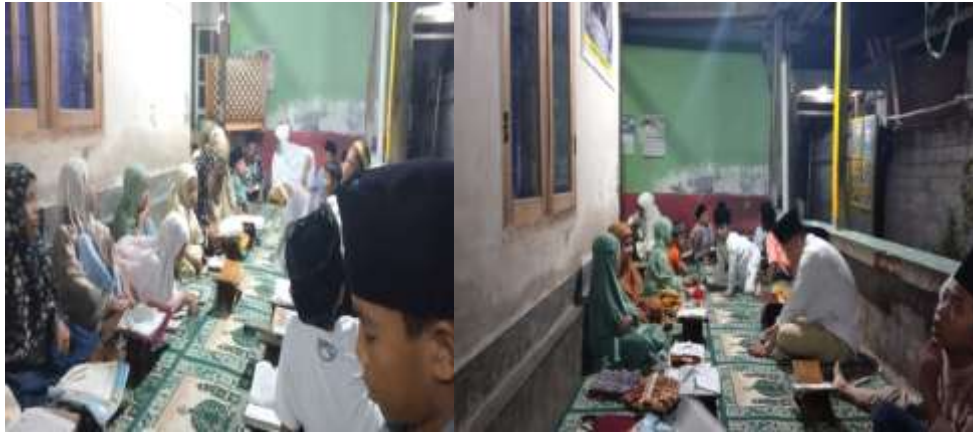
Gambar 3. Praktik Makharijul huruf.

Bimbingan makharijul huruf ini berjalan dengan lancar karena bantuan dari tenaga pendidik setempat serta semangat yang luar biasa dari anak-anak TPQ Sunanul Huda yang selalu sabar dan tetap istiqomah mengikuti bimbingan ini sampai selesai. Namun dalam prosesnya, tentu saja bimbingan dasar makharijul huruf ini juga terdapat beberapa kendala, misalnya beberapa anak masih bingung dalam membedakan makhraj dari huruf-huruf hijaiyah, bunyi dan gerak-gerik mulut dalam pelafalannya. Disisi lain, dengan diadakannya bimbingan dasar makharijul huruf ini membawa banyak perubahan seperti meningkatkan kemampuan membaca Al-Qur'an anak-anak di TPQ Sunanul Huda, dalam hal ini pemahaman anak-anak tentang makharijul huruf meningkat.