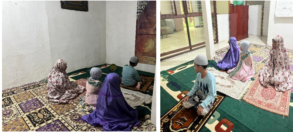
Gambar 6, 7, 8, dan 9 Praktek Shalat Berjamaah.

Shalat berjamaah juga mengajarkan pentingnya kebersamaan dalam ibadah. Ketika santri shalat bersama-sama, mereka merasakan kekuatan dalam kebersamaan, saling mendukung, dan menghargai satu sama lain. Hal ini menguatkan pemahaman bahwa ibadah tidak hanya tentang hubungan individu dengan Tuhan, tetapi juga membangun hubungan sosial yang harmonis antar sesama. Kebersamaan dalam shalat berjamaah ini juga mengajarkan disiplin, karena setiap santri harus hadir tepat waktu dan melaksanakan ibadah sesuai dengan aturan yang telah ditetapkan. Praktek shalat berjamaah ini diharapkan dapat memperkuat kualitas ibadah santri dan memberikan pengalaman langsung yang lebih mendalam tentang tata cara shalat yang benar.