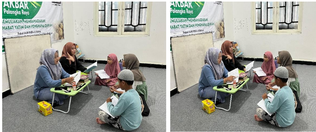
Gambar 2 dan 3 Peneliti Menjelaskan Materi.