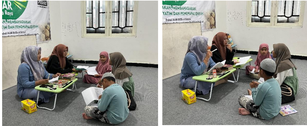
Gambar 4 dan 5 Peneliti dan Santri Melakukan Tanya Jawab.