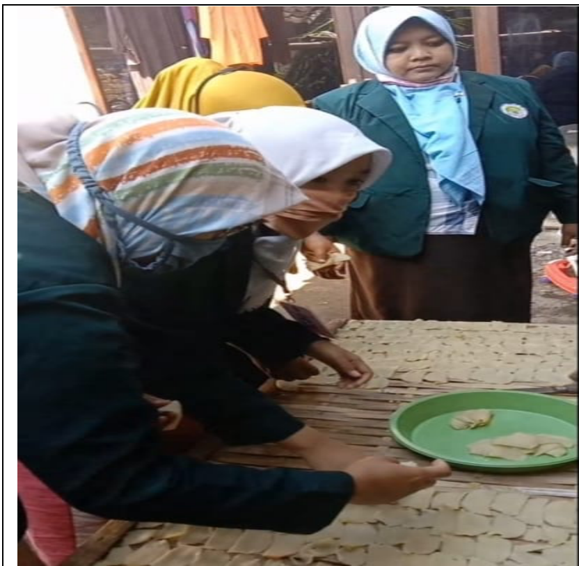
Dokumentasi: pelatihan pengolahan umbi talas.