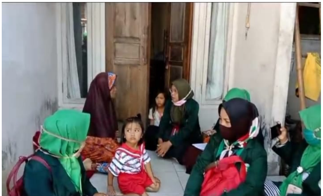
Dokumentasi: Proses silaturahmi dengan komunitas Wali Murid TK Dharma Wanita Desa Sukosari

Hasil wawancara ini didukung oleh data hasil observasi dan dokumentasi. Hasil observasi menunjukkan bahwa: 1) Sarana dan prasarana kurang memadai, 2) Belum adanya alat untuk packing/pengemasan, 3) Kurangnya jaringan pemasaran dan gptek (tidak mengenal media sosial), 4) Di komunitas masih minim peralatan produksi sehingga hasil produksi belum efektif dan efisien 5) Tempat pengolahan kurang memadai. berdasarkan hasil dokumentasi menunjukkan bahwa struktur komunitas sudah ada dan anggota komunitas 5 wali murid