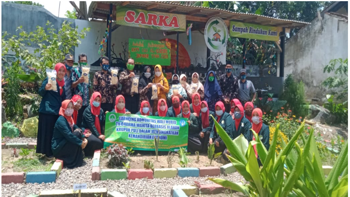
Dokumentasi: launching hasil olahan krupuk puli dan umbi talas yang di hasilkan oleh komunitas wali murid TK Dharma Wanita