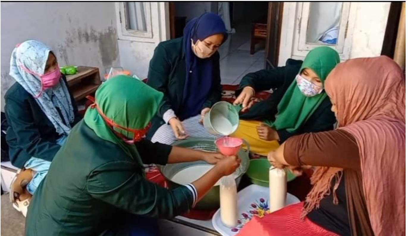
Dokumentasi: pelatihan pengolahan krupuk puli