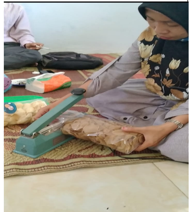
Dokumentasi; praktek pengemasan produk olahan krupuk puli dan umbi talas