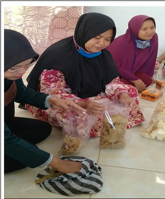
Dokumentasi; praktek pengemasan produk olahan krupuk puli dan umbi talas

Dokumentasi: pelatihan packing olahan krupuk puli dan umbi talas