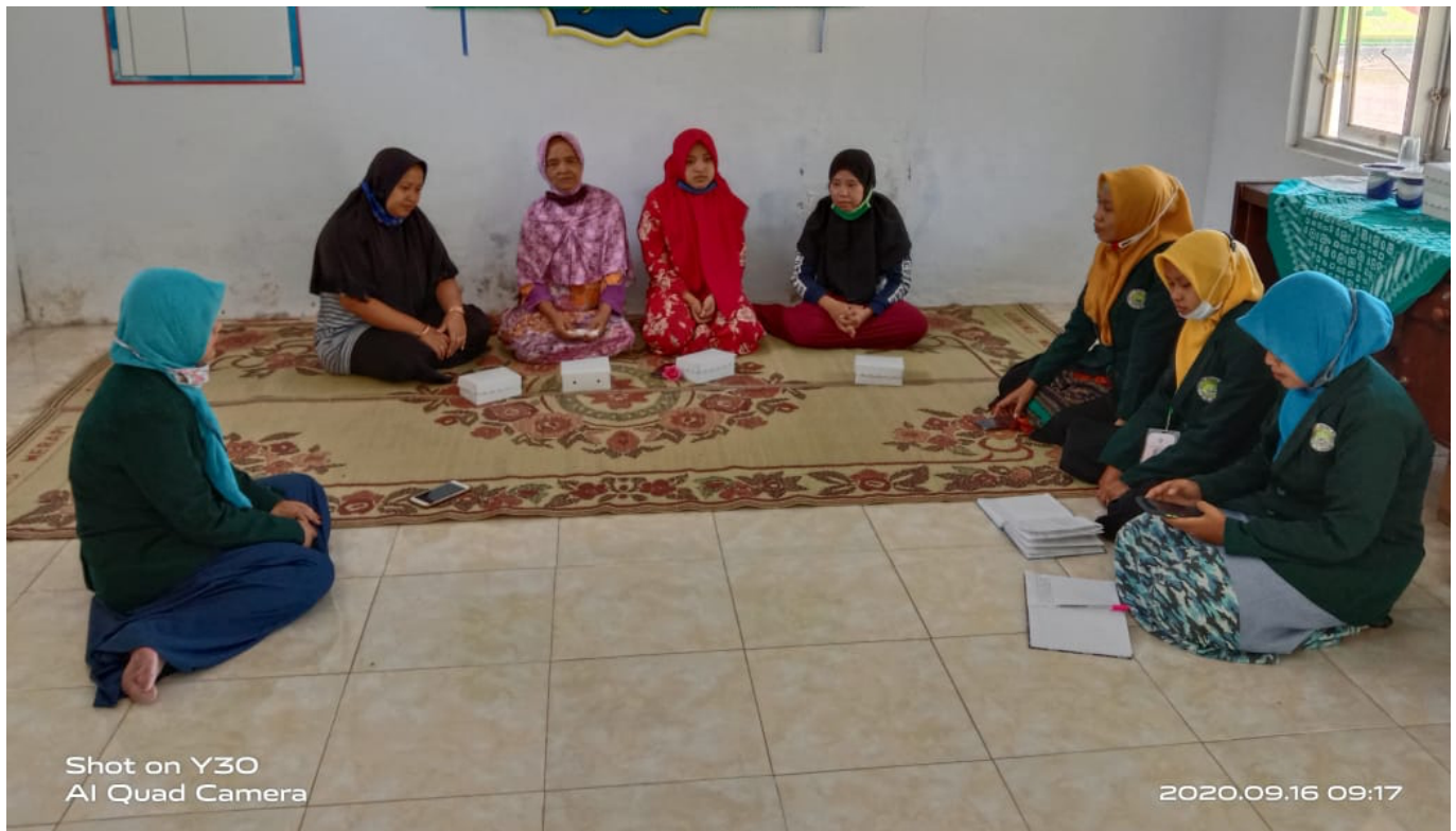
Dokumentasi: Proses Penyusun Design

Kelima, Deliver atau Destiny. Tahap Deliver atau Destiny adalah tahap di mana setiap orang dalam organisasi mengimplementasikan berbagai hal termasuk pelaksanaan dan pengontrolan atau pengevaluasian program dampingan terhadap komunitas yang sudah dirumuskan pada tahap Dream dan Design . Di dalam tahap deliver atau destiny ini, terdapat beberapa tahapan yang akan dilakukan, yaitu sebagai berikut: