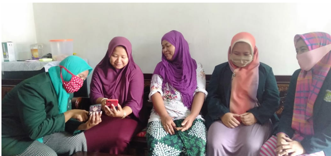
Dokumentasi: Proses Penyusunan Dream

Ketiga, Dream. Tahapan ini merupakan mimpi atau keinginan atau tujuan yang diharapkan komunitas dampingan dalam mengembangkan asset (potensi) komunitas. Setelah menemukan 5 asset yang dimiliki komunitas dan fokus asset yang akan dikembangkan, maka langkah selanjutnya adalah merumuskan keinginan atau tujuan untuk mengembangkan asset komunitas yang diinginkan atau diimpikan oleh Komunitas Wali Murid TK Dharma Wanita II Desa Sukosari Kec. Sukowono Jember. Adapun hasil rumusan tujuan atau impian yang diinginkan adalah Pengembangan kreatifitas anggota komunitas dalam mengelola krupuk puli dan umbi talas agar enak dan memiliki cita rasa yang bervariasi, mengembangkan asset krupuk puli mentah dan umbi talas dalam pengemasan yang lebih menarik, dan meningkatkan penjualan hasil produk ke pemasaran online (WA,FB,IG, dll)