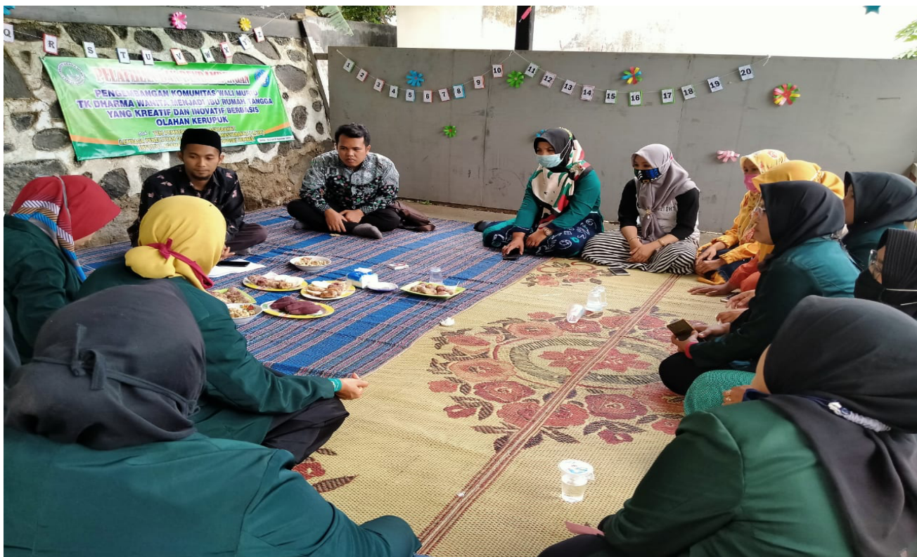
Dokumentasi: penyampaian materi pelatihan