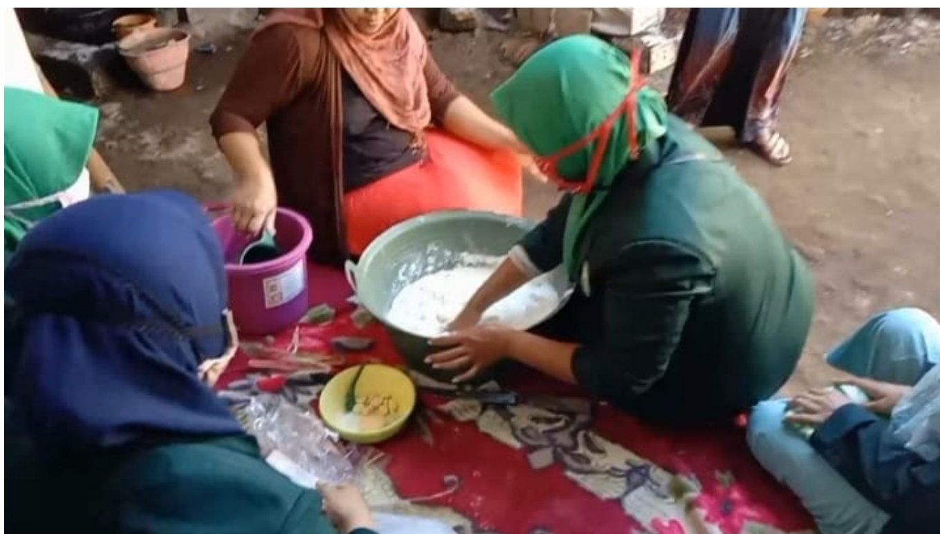
Dokumentasi: pelatihan pengolahan krupuk puli