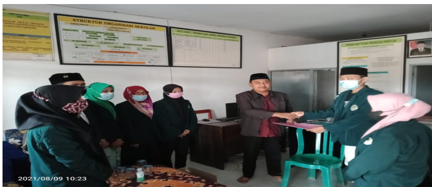
Gambar 1.1 Wawancara dengan Komunitas Dampingan

Dari hasil petikaan wawancara menunjukkan bahwasannya MTs Tarbitul Ihsan dari segi aset guru secara keseluruhan menunjukkan semangat tinggi dalam memberikan pembelajaran kepada siswa yang ada dilembaga namun sampai saat ini masih belum mempunyai sarana dan prasarana yang cukup memadai dalam dalam mengembangkan pembelajaran yang lebih baik lagi, meskipun demikian MTs Tarbiyatul Ihsan terdapat program unggulan yaitu program Darul Lughah.