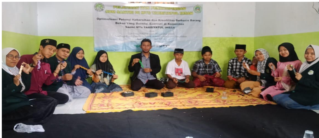
Gambar 1.3 Pemberdayaan pada Komunitas Dampingan