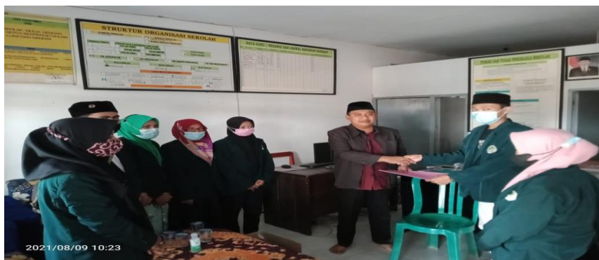
Gambar 1.1 Wawancara dengan Komunitas Dampingan

Dari hasil petikaan wawancara menunjukkan bahwasannya MTs Tarbitul Ihsan dari segi aset guru secara keseluruhan menunjukkan semangat tinggi dalam memberikan pembelajaran kepada siswa yang ada dilembaga namun sampai saat ini masih belum mempunyai sarana dan prasarana yang cukup memadai dalam dalam mengembangkan pembelajaran yang lebih baik lagi, meskipun demikian MTs Tarbiyatul Ihsan terdapat program unggulan yaitu program Darul Lughah.