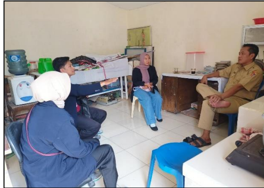
Gambar 1. Kegiatan Diskusi dengan Perangkat Desa terkait Proker Pojok Baca

Selanjutnya setelah proses diskusi dengan perangkat desa, kami lalu memproses rak buku yang akan dijadikan pojok baca dengan cara membuat rak buku tersebut dibantu oleh tukang kayu dan kami sepakat rak baca tersebut akan selesai di hari minggu bersamaan dengan penataan buku di pojok baca.