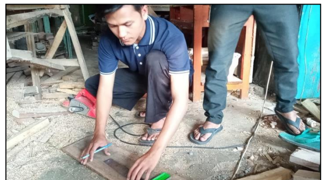
Gambar 2. Mendiskusikan Bentuk Rak Pojok Baca bersama Tukang Kayu dan Proses Pembuatan Rak Pojok Baca

Setelah proses diskusi dan pembuatan rak pojok baca yang mana waktu pengerjaannya tepat waktu maka selanjutnya adalah proses peletakan pojok baca di balai desa Umbulrejo pada hari minggu yang mana di kerjakan bersama-sama dan bersamaan dengan proses penataan nama pojok baca, buku-buku yang sudah. Pojok baca ini diletakkan di pojok berhadapan persis dengan pintu masuk balai desa sehingga orang yang baru masuk balai desa akan langsung tertuju pada pojok baca tersebut. Pojok baca ini bukan hanya sebuah pajangan yang hanya