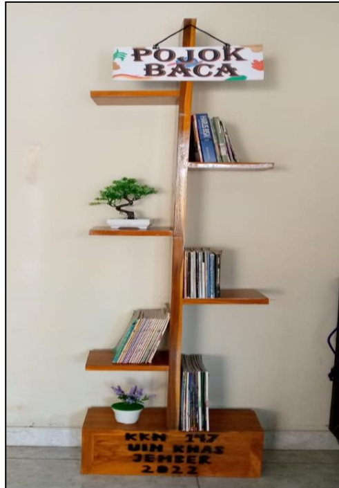
Gambar 3. Peletakan Pojok Baca di Balai Desa Umbulrejo

dilihat saja tetapi akan selalu menjadi penambah referensi membaca dan peningkatan literasi membaca masyarakat Umbulrejo yang berkunjung atau sedang ada keperluan di balai desa Umbulrejo, sehingga bisa mengisi waktu menunggunya dengan membaca buku di pojok baca.