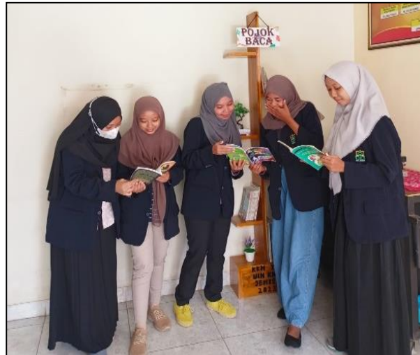
Gambar 4. Promosi Pojok Baca kepada Perangkat Desa oleh Mahasiswa KKN

Proses demi proses kami lakukan dari yang berdiskusi bersama perangkat desa, membuat rak pojok baca, penempatan pojok baca di balai desa hingga mempromosikan pojok baca yang ada di balai desa melalui perangkat desa hingga bisa sampai di masyarakat dan teman-teman kkn lainnya agar bisa mengetahui bahwa program kerja kami terkait pojok baca bisa terlaksana dan di akhir ini, kami mulai melakukan evaluasi terkait apakah pojok baca ini bisa diterima oleh masyarakat dan mengalami perkembangan di balai desa dengan melihat banyak pembaca buku dan masyarakat yang mampir meskipun hanya sekedar melihat-lihat ada apa saja di pojok baca di balai desa Umbulrejo. Berikut adalah diagram jumlah pengunjung pojok baca di balai desa Umbulrejo, Kec. Umbulsari