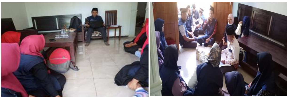
Gambar. 3.3. Dokumentasi: Proses FGD Penyusunan Dream

Keempat, Design. Pada tahap ini, pendamping atau pelaku pemberdayaan dengan komunitas dampingan dan sebagainya memulai untuk merumuskan strategi, proses dan sistem, membagi peran dan tanggung jawab, membuat keputusan dan mengembangkan kolaborasi yang mendukung terwujudnya penyelesaian masalah komunitas dampingan dan perubahan yang diharapkan dari komunitas dampingan. Adapun hasil desain program yang akan dilakukan untuk mewujudkan keinginan, impian atau tujuan yang telah ditetapkan tersebut yaitu: