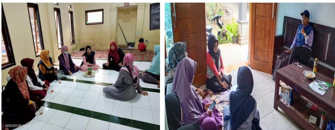
Gambar. 3.4. Dokumentasi: Proses FGD Penyusun Design

Kelima, Deliver atau Destiny. Tahap Deliver atau Destiny adalah tahap di mana setiap orang dalam organisasi mengimplementasikan berbagai hal termasuk pelaksanaan dan pengontrolan atau pengevaluasian program dampingan terhadap komunitas yang sudah dirumuskan pada tahap Dream dan Design . Di dalam tahap deliver atau destiny ini, terdapat beberapa tahapan yang akan dilakukan, yaitu sebagai berikut: