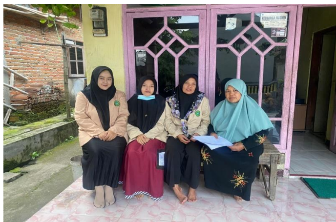
Gambar 3.1 merencanakan progam pengajian kitab

Pada permasalahan yang ada dalam kegiatan TPQ lansia, Mahasiswa KKN merencanakan aksi penyelesaian masalah. Peserta KKN desa Ngrowo memiliki rencana kegiatan pengajian kitab untuk menguatkan makharijul huruf, kajian fiqih serta pengajian aswaja an-nahdiyah di TPQ lansia desa ngrowo, dusun Pendowo. Pada hari hari sebelumnya, Tim KKN desa Ngrowo sudah observasi dan memutuskan untuk melakukan program “Makharijul huruf, kajian fiqih serta Penguatan Aswaja An-Nahdiyah TPQ Lansia” yang dilaksanakan pada tanggal 05 Maret 2023 hari Minggu bertempat di Masjid Al Mukarromah dusun Pendowo, program ini bertujuan untuk memberi wawasan bagi santri lansia dan mengembangkan potensi guru yang mengajar.