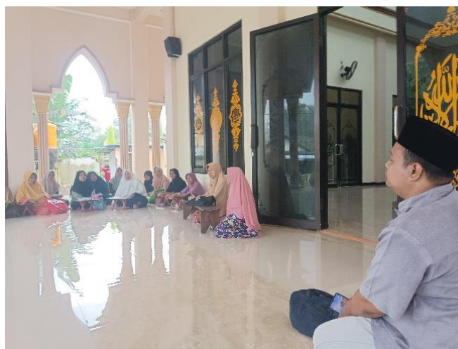
Gambar 4.1 Persiapan penguatan materi tajwid.

Menurut kamus Al-Muhith 9 al-abdiyah , al-ubudiyah , dan al-ibadah artinya taat. Dan dalam Mukhtar AshShihhah 10 , Arti dasar al-Ubudiyah adalah ketundukan dan pengabdian, sedangkan atta'bid berarti pengabdian. Dikatakan thariq (jalan) itu muabbad dan unta itu muabbad artinya sudah siap. Semua makna ini sesuai dengan isytiqaq beliau. Meskipun ubudiyah berarti penyerahan meskipun kata itu adalah ibadah dalam maknanya karena itu adalah puncak penyerahan dan tidak ada yang berhak diperbudak kecuali yang memiliki puncak yaitu Allah SWT.