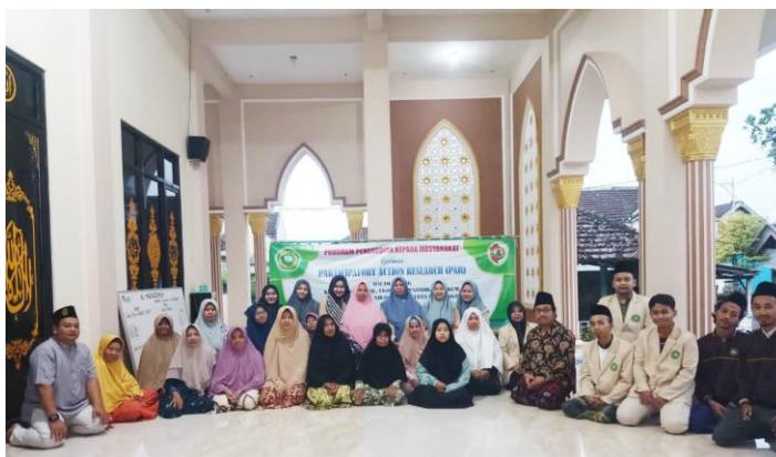
Gambar 5.2 foto bersama pasca penyuluhan

Selain itu, kegiatan pengabdian menjembatani antara ranting NU ngrowo dengan TPQ lansia dusun pendowo untuk menambah SDM pengajar di TPQ lansia dusun pendowo ada di refleksi dan rekomendasi. Berikut adalah referensi penyerahan tajwid kepada TPQ lansia :