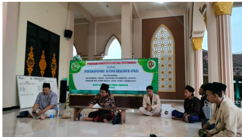
Gambar 5.1 pelaksanaan penyuluhan

shalat dan membaca Al-Qur'an. Shalat merupakan usaha seorang muslim untuk mendekatkan diri kepada Allah, sedangkan membaca Al-Qur'an merupakan usaha dasar untuk memahami hukum-hukum Allah yang terkandung dalam Al-Qur'an. 14