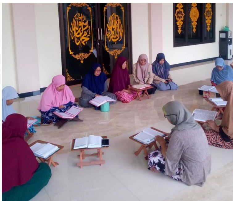
Gambar 2.2 Mengikuti kegiatan mengaji TPQ lansia

Pada minggu kedua, Kegiatan pengabdian pada masyarakat bertujuan untuk memahami persoalan utama komunitas untuk berdiskusi pada masyarakat untuk menemukan fokus masalah. Masalah yang ada di TPA adalah sebagai berikut: Kurangnya SDM yang dapat mengajar TPQ Lansia Masalah dapat dibuktikan dengan kurangnya minat pemuda dan pemudi sebagai penyambung ilmu. Saran – saran pemecahan masalah, Dapat diatasi dengan mengadakan sosialisasi dan motivasi akan pentingnya TPQ. Kekurangannya SDM dapat ditambah dengan mendatangkan guru PAI dari sekolah – sekolah yang berada dekat dari mushola.