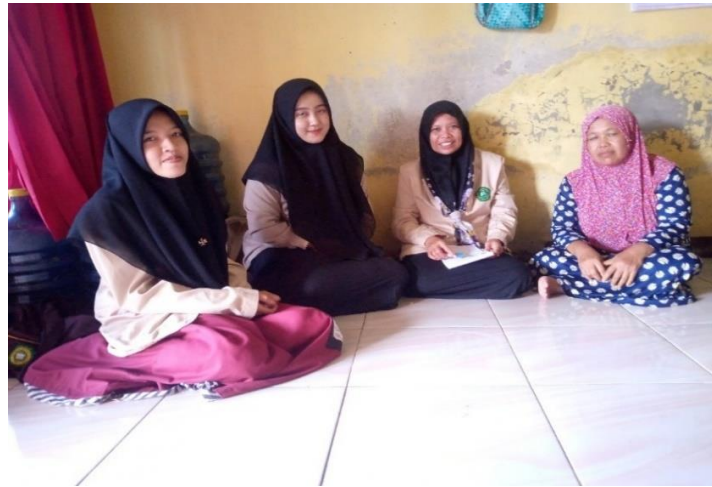
Gambar 2.1 silaturahmi ke rumah yang mengajar TPQ Lansia

Berikut table tempat tinggal dan usia dari para santri TPQ lansia dusun ngrowo.