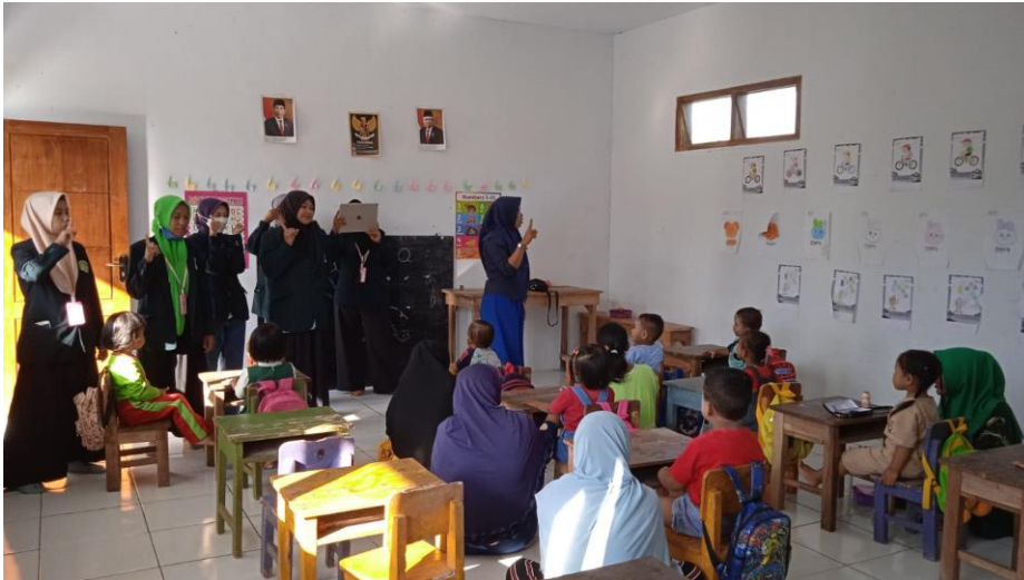
Dokumentasi: Proses praktek dampingan