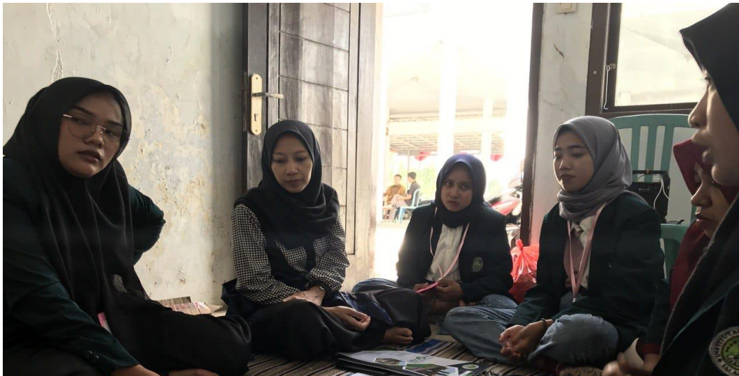
Dokumentasi: Tahap Dream

Keempat, Design. Pada tahap ini, pendamping atau pelaku pemberdayaan dengan komunitas dampingan dan sebagainya memulai untuk merumuskan strategi, proses dan sistem, membagi peran dan tanggung jawab, membuat keputusan dan mengembangkan kolaborasi yang mendukung terwujudnya penyelesaian masalah komunitas dampingan dan perubahan yang diharapkan dari komunitas dampingan. Adapun hasil desain program yang dilakukan untuk mewujudkan keinginan, impian atau tujuan yang telah ditetapkan tersebut yaitu: