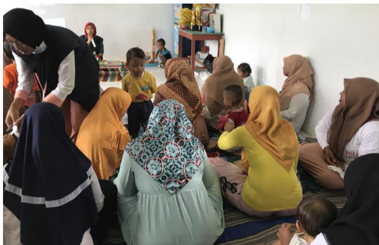
Dokumentasi: Proses penyampaian materi Kompetensi Pedagogik