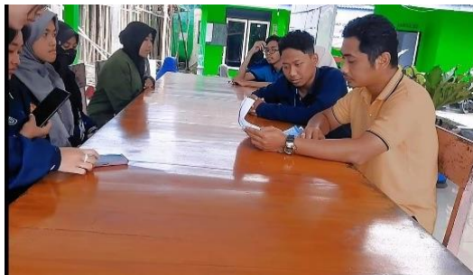
Gambar 8 Pengenalan program kerja

diskusi yang dilakukan, program yang kami rancang mendapat persetujuan dan dukungan karena program ini dinilai bermanfaat bagi masyarakat Desa Mojomulyo terutama masyarakat pesisir pantai Cemara.