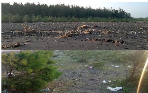
Gambar 5 Sampah organik dan anorganik

Sampah di pantai Cemara yang ditemukan juga terdiri dari sampah organik dan anorganik yang dapat dilihat pada Gambar 5. Sampah organik didominasi oleh ranting pohon dan batok kelapa sedangkan sampah anorganik didominasi sampah plastik seperti bungkus makanan ringan. Hasil dari survey juga mendapatkan informarsi bahwa sumber sumber sampah yang ada dari pantai Cemara berasal dari alam, sungai, dan juga sampah pengunjung yang dibuang sembarangan.