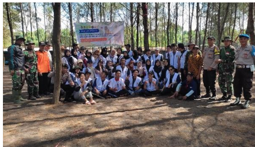
Gambar 17 Foto bersama