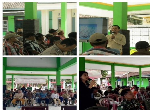
Gambar 12 Kegiatan sosialisasi

berupa doa dan pengarahan serta sambutan dari ketua panitia yang dilanjutkan dengan pembawaan materi oleh perwakilan dari Dinas Lingkungan Hidup Jember. Materi yang dibawa oleh beliau adalah mengenai awal mula pantai Cemara, sampah yang dapat mengganggu perekonomian warga pesisir pantai, pentingnya kebersihan wisata pantai dan juga bagaimana pengelolaan sampah yang benar. Gambar 12 merupakan dokumentasi dari kegiatan sosialisasi yang diadakan. Setelah pembawaan materi selesai, dilanjutkan dengan pemberitahuan kegiatan aksi bersih pantai yang akan dilaksanakan pada hari Rabu tanggal 9 Agustus 2023. Kegiatan sosialisasi ini pun berakhir dan ditutup dengan doa dan dengan sebuah harapan mampu meningkatkan kepedulian dan kesadaran masyarakat akan pentingnya kebersihan pantai. Kegiatan sosialisasi dapat diselenggarakan dengan lancar dan sesuai dengan susunan kegiatan yang telah dirancang sebelumnya.