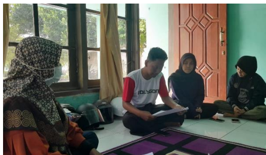
Gambar 7 Diskusi perancangan program

Tahap selanjutnya yang kami lakukan adalah berdiskusi dalam perancangan program yang sesuai diterapkan untuk meningkatkan keunggulan yang ada di Desa sekaligus mengatasi permasalahan yang dihadapi. Pada Gambar 7 adalah proses diskusi perancangan program kerja yang dalam diskusi tersebut menghasilkan program bernama CERIA yaitu sebuah akronim dari Cegah dan Rawat Indahnya Alam. Program ini berisi dua kegiatan yaitu yang pertama adalah sosialisasi kepada masyarakat terkait pentingnya menjaga lingkungan pantai wisata dan bahaya akan sampah. Kemudian kegiatan kedua adalah aksi bersih pantai di pantai Cemara. Program ini bertujuan untuk menjadikan pantai Cemara menjadi pantai wisata yang ramah lingkungan.