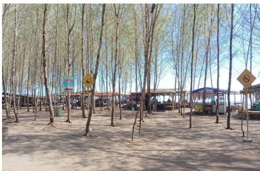
Gambar 1 Pantai Cemara

Salah satu potensi yang patut diperhatikan datang dari sektor pariwisata yaitu Pantai Cemara yang terletak di Dusun Kalimalang, Desa Mojomulyo, Kecamatan Puger. Pantai Cemara merupakan salah satu destinasi wisata masyarakat Jember dikarenakan keunikan dimana pantai identik dengan pohon kelapa namun di pantai ini justru banyak pohon cemara yang ditunjukkan pada Gambar 1. Selain keunikannya dengan pohon cemara, tarif masuk yang ramah di kantong juga menjadi alasan wisatawan untuk datang berkunjung ke pantai Cemara. Para wisatawan yang datang membantu pertumbuhan ekonomi masyarakat sekitar. Pohon cemara yang berada di pantai ini selain menjadi pengikat wisatawan, juga memiliki banyak manfaat diantaranya adalah menjaga ekosistem pantai, pelindung dari abrasi dan tsunami, menjadi tempat tinggal hewan-hewan tertentu, dan menjadi pemecah angin. 2