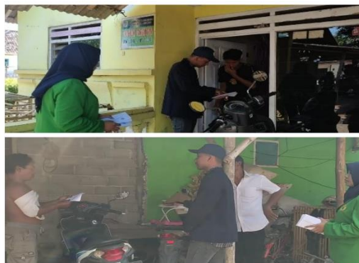
Gambar 11 Penyebaran undangan sosialisasi

Setelah mendapatkan respon yang baik dari Dinas Lingkungan Hidup, kami mempersiapkan undangan sosialisasi kepada masyarakat, penyebaran dilakukan tanggal 2 Agustus 2023 yang dapat dilihat pada Gambar 11. Kegiatan Sosialisasi rencananya akan dilaksanakan pada hari Jum'at tanggal 4 Agustus pukul 13.00 WIB di Balai Desa Mojomulyo.