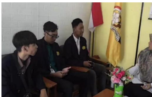
Gambar 14 Koordinasi dengan SMPN 3 Puger

Hal kedua yang kami persiapkan adalah berkoordinasi dengan SMPN 3 Puger yang dapat dilihat pada Gambar 14. Koordinasi yang dilakukan bertujuan untuk mengundang warga sekolah dalam mengikuti kegiatan aksi bersih pantai. Dari koordinasi tersebut, mendapatkan respon positif dikarenakan dari pihak sekolah juga memiliki program yang hampir sama yaitu clean up day . Dan yang terakhir adalah membuat undangan resmi ke beberapa pihak diantaranya ke Kecamatan, Polsek Kecamatan Puger, Koramil Kecamatan Puger, POLAIRUD, Babinsa, Bhabinkamtibmas Desa Mojomulyo yang didokumentasikan pada Gambar 15. Tidak lupa juga kami mengundang mahasiswa KKN-K yang ada di Kecamatan Puger dan masyarakat Desa Mojomulyo.