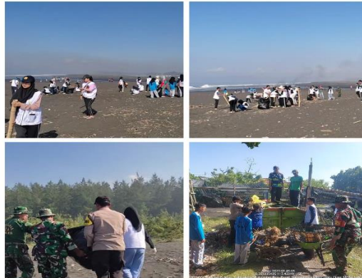
Gambar 16 Kegiatan aksi bersih

sampah yang ada di sekitar pantai Cemara. Kegiatan aksi bersih ini berlangsung selama 2 jam yaitu mulai pukul 08.00 sampai dengan pukul 10.00 WIB. Selama waktu tersebut kami berhasil mengumpulkan sekitar 40 kantong trash bag dengan didominasi oleh sampah organik yang bersumber dari alam yaitu ranting pohon. Namun karena keterbatasan kantong plastik sampah, kegiatan aksi bersih pantai ini tidak berlangsung secara maksimal. Setelah selesai, diadakan sesi dokumentasi dengan foto bersama yang dapat dilihat pada Gambar 17.