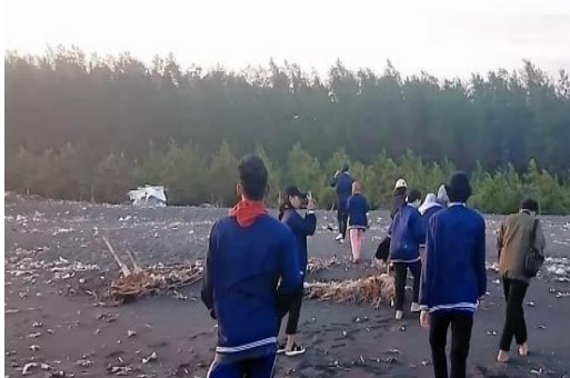
Gambar 4 Survey lokasi pantai Cemara

Namun, saat ini pantai yang menjadi ikon terancam dengan adanya sampah. Kondisi ini terlihat saat kami melakukan survey lapangan ke pantai Cemara hari Senin, 24 Juli 2023 yang dapat dilihat pada Gambar 4. Sampah memang menjadi permasalahan besar di Indonesia yang dari tahun ke tahun terus bertambah. 9 Pantai Cemara berkurang keindahannya dikarenakan oleh sampah. Sampah dibagi menjadi dua jenis yaitu organik dan anorganik.