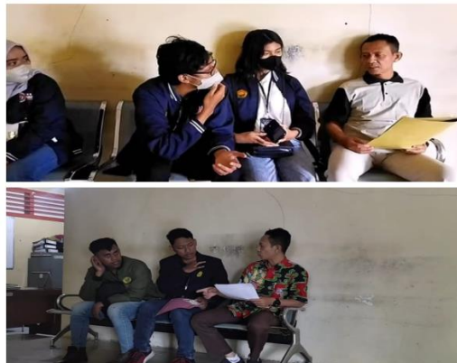
Gambar 10 Kunjungan ke Dinas Lingkungan Hidup

tersebut dengan menyetujui untuk menjadi pemateri namun untuk aksi bersih pantai hanya dapat membantu mengirimkan armada truk untuk mengangkut sampah hasil dari kegiatan aksi bersih. Pihak Dinas Lingkungan Hidup mengajukan beberapa syarat yaitu perlunya surat-surat dan juga poster beserta jadwal acara sosialisasi. Kunjungan yang kedua dan ketiga masing-masing pada tanggal 28 Juli 2023 dalam rangka memberikan surat-surat dan poster kegiatan dan tanggal 3 Agustus untuk memastikan pemateri serta pemberian lampiran apa saja yang kami butuhkan dalam aksi bersih pantai yang dapat dilihat pada Gambar 10.