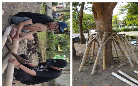
Gambar 13 Pembuatan garpu sampah

Setelah dilaksanakannya kegiatan sosialisasi, kami mulai mempersiapkan untuk kegiatan selanjutnya yaitu untuk aksi bersih pantai di pantai Cemara. Hal pertama yang kami siapkan yaitu alat kebersihan seperti sarung tangan plastik, trash bag , dan juga garpu sampah sederhana. Minggu, 7 Juli 2023 kami membuat garpu sampah dengan bahan-bahan seperti bambu, batang tumbuhan, dan juga paku. Dengan keterbatasan bahan, kami berhasil membuat 10 buah garpu sampah yang dapat dilihat pada Gambar 13.