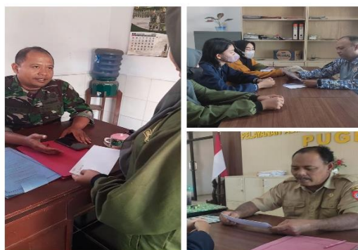
Gambar 15 Penyebaran undangan

Pada hari Rabu, tanggal 9 Agustus 2023 dilaksanakan kegiatan aksi bersih pantai. Aksi bersih pantai ini diikuti oleh mahasiswa KKN-K Mojomulyo sebagai penyelenggara, kemudian Dinas Lingkungan Hidup, Polsek Kecamatan Puger, Koramil Kecamatan Puger, POLAIRUD, Babinsa, Bhabinkamtibmas Desa Mojomulyo, SMPN 3 Puger, mahasiswa KKN-K Mojosari dan Kasian timur, dan juga dari masyarakat Desa Mojomulyo yang berasal dari dua dusun yaitu Dusun Kalimalang dan Dusun Krajan. Kegiatan ini merujuk dari gerakan bersih pantai internasional yang dikenal dengan International Coastal Cleanup (ICC) yang mencerminkan masyarakat memiliki kepedulian terhadap ekosistem pantai (Dewi, 2022). Sebelum kegiatan aksi bersih pantai dimulai, terlebih dahulu dilakukan pengarahan kepada peserta ataupun relawan melalui apel pagi. Pada Gambar 16, dapat dilihat saling membantu untuk membersihkan